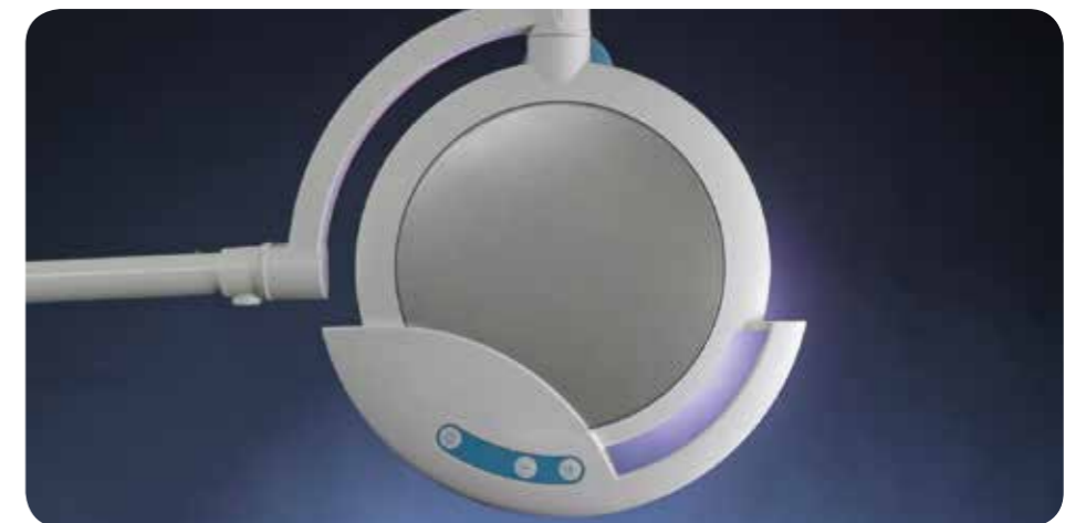
Säädettävä valon kirkkaus kahvasta sekä ohjauspaneelista.