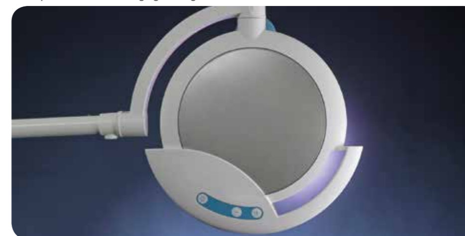
Kontrollpanel på ovansida lamphuvud