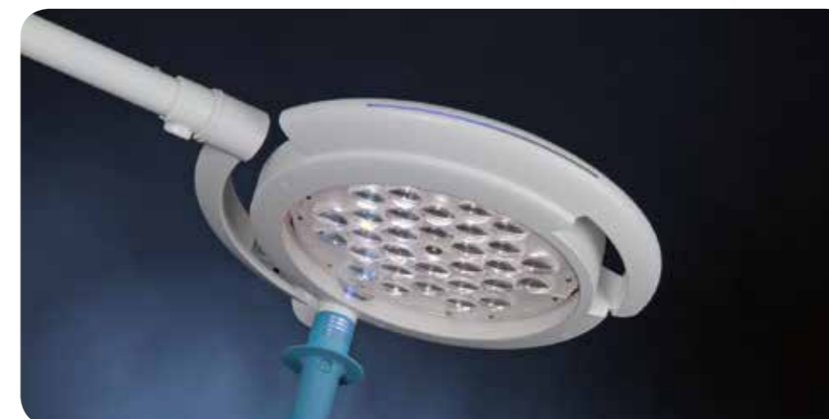
Lamphuvud med sterilt flergångshandtag